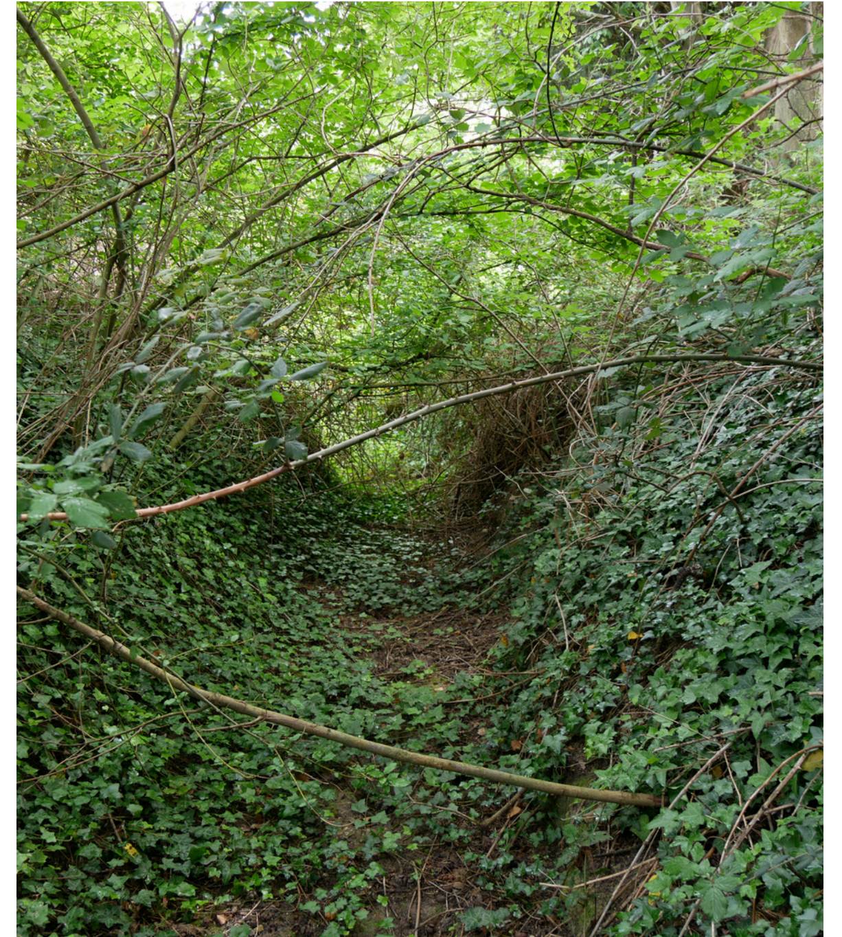
L'ancien canal de Taulignan permet toujours d'arrêter et répartir le ruissellement des eaux de pluie, et favoriser leur infiltration